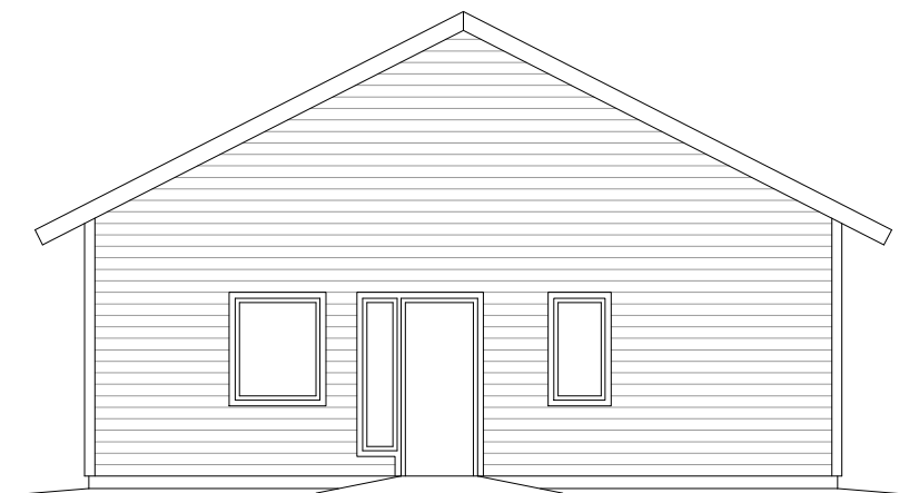
FASAD - GAVEL 1:100