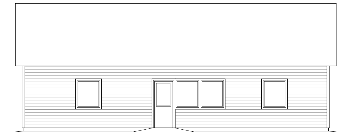
FASAD - BAKSIDA 1:100